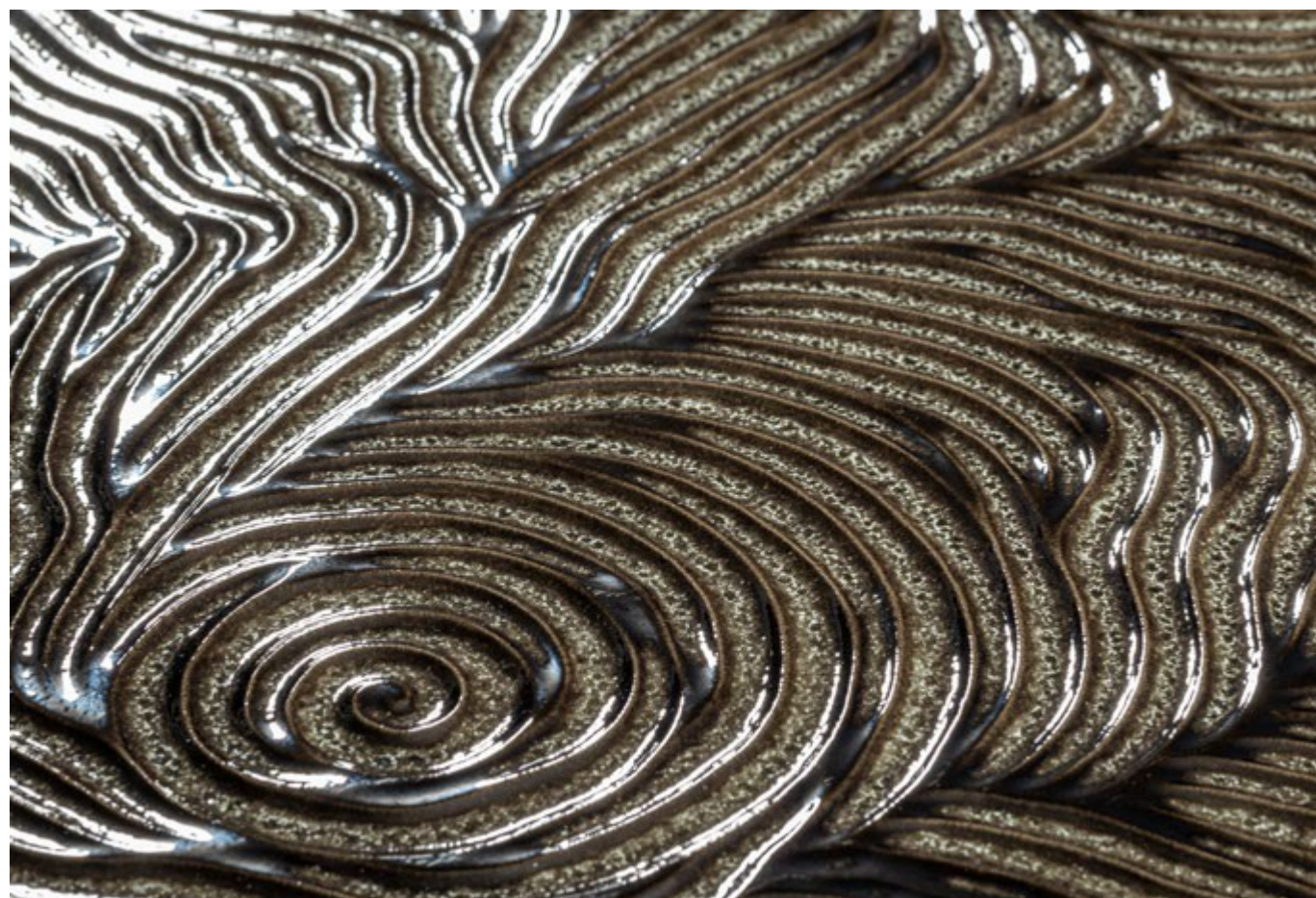
Detail : GLAM Silver Rose