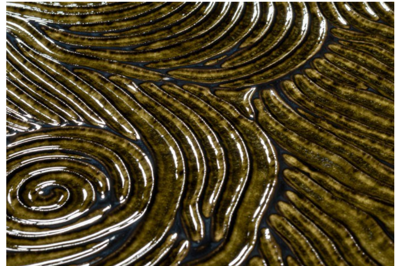
Detail : GLAM Green Rose