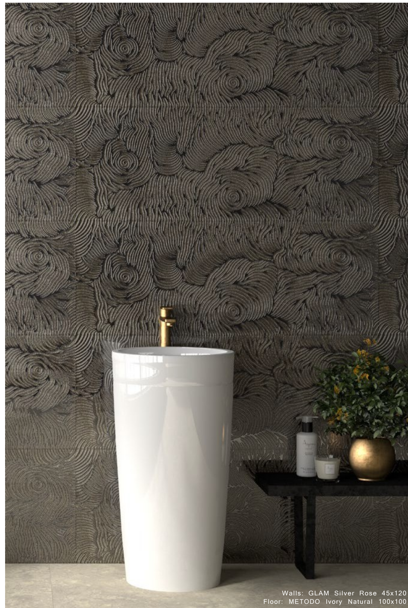
Walls: GLAM Silver Rose 45x120 Floor: METODO Ivory Natural 100x100